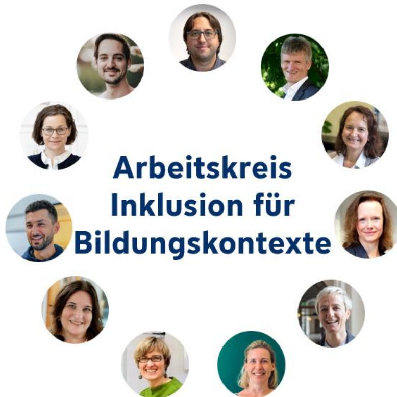
Abbildung 2: Eigene Darstellung (Fabian Schwab); erstellt mit Powerpoint.

Derzeit wirken im Arbeitskreis zusätzlich zu den oben genannten Gründungsmitgliedern folgende Personen mit (alphabetische Reihenfolge):