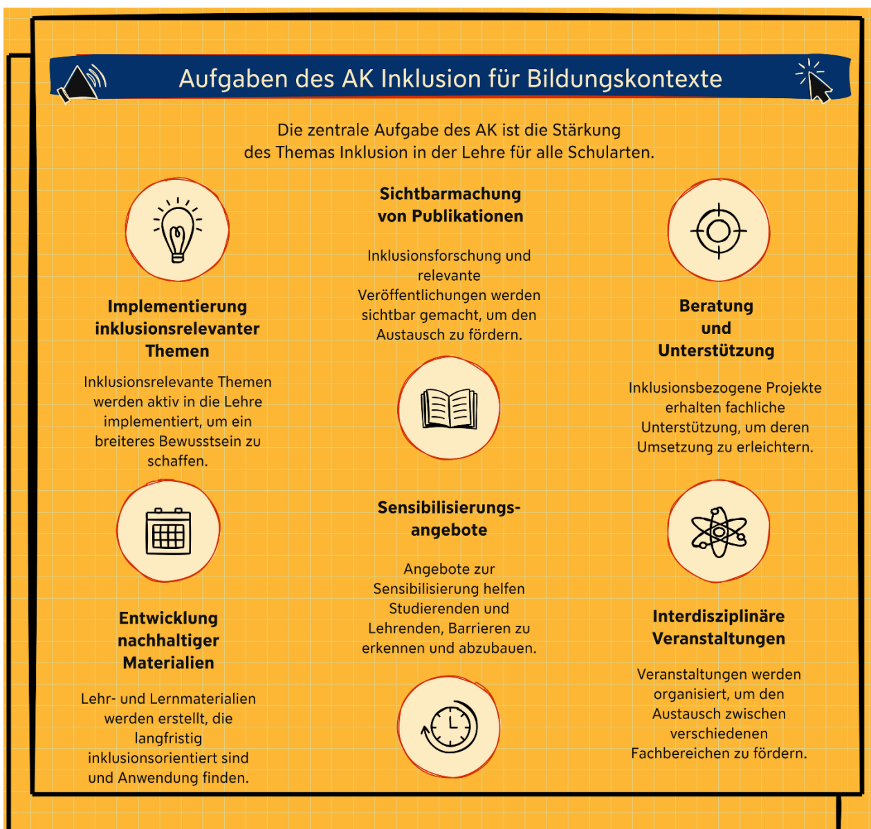
Abbildung 3: Eigene Darstellung (Fabian Schwab); erstellt mit SketchWow.

Vor diesem Hintergrund trägt der AK Inklusion für Bildungskontexte der FAU dazu bei, das Querschnittsthema Inklusion in die verschiedenen Bereiche der Lehrkräftebildung zu bringen und Lehrende wie Studierende für die Thematik nicht nur zu sensibilisieren, sondern auch entsprechende Kompetenzen grundzulegen.